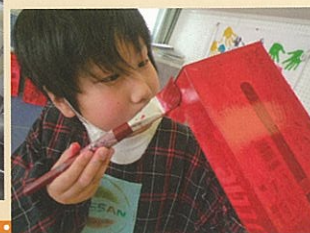
車のペイント工程