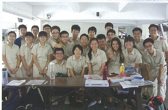
制服を借りHWA CHONGの一員となった筑波生徒(前列真ん中)

一方、筑波側からは、3月28日から4月6日までの期間、10名の生徒(男子2名、女子8名、うち女子3名は附属中学校から)がHWA CHONGに短期留学しました。HWA CHONGは、広大な敷地に充実した施設があり、講堂や理科系の実験室などの設備はもちろん、陸上の400mトラックや大きな