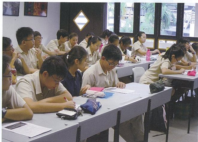
一緒に授業を受ける筑波生徒(私服)

今後もこのような国際交流が根付き、両校はもとより、両国の友好関係がさらに確固たるものになることが望まれます。