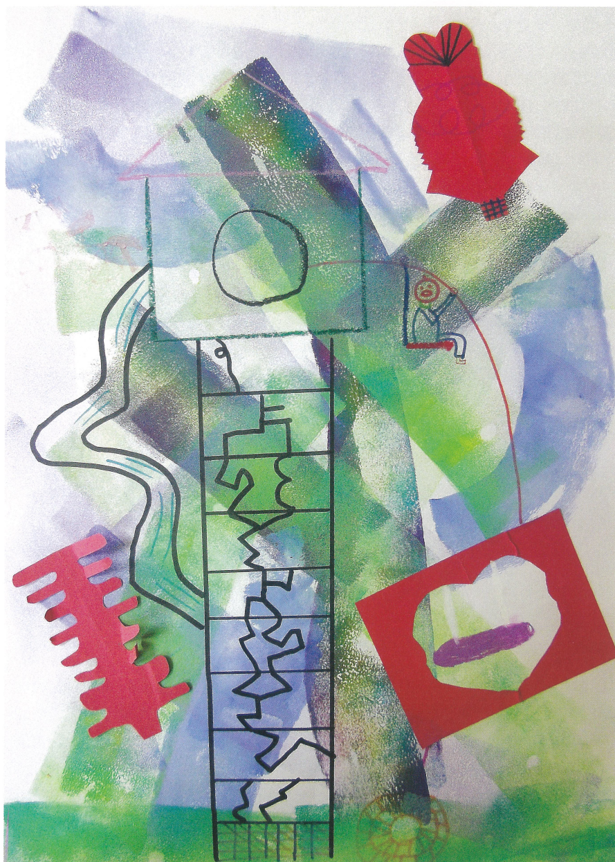
絵:「赤い実のなる木」福原聖叶(附属小学校4部3年)