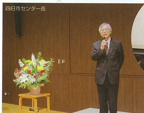
四日市センター長