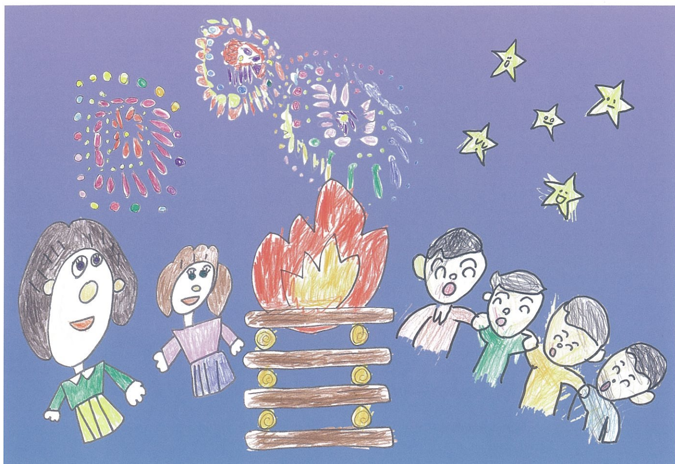
絵:黒姫高原共同生活のしおりの表紙から(附属大塚特別支援学校小学部6年・中学部2年共同制作)