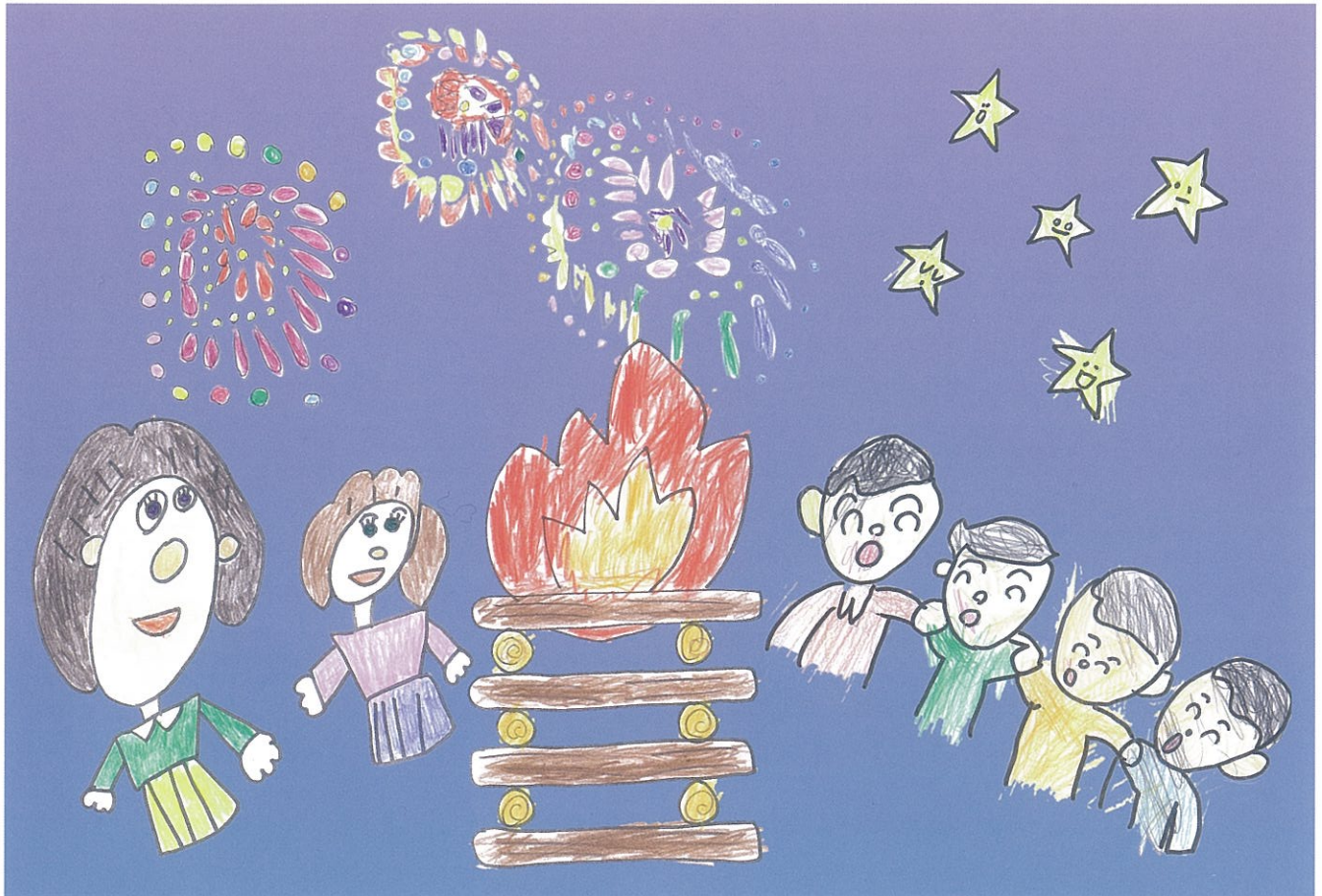
絵：黒姫高原共同生活のしおりの表紙から（附属大塚特別支援学校小学部 6 年・中学部 2 年共同制作）