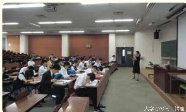
大学でのミニ講座

筑波大学附属視覚特別支援学校の高等部では、総合的な学習の時間において、高等部2年生を対象とした筑波大学のキャンパス体験に1日出かけます。(今年度は7月12日に実施)