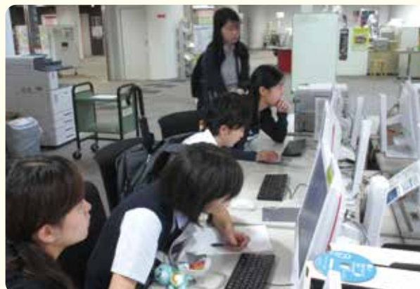
図書館で学生と一緒に本を探す体験

進学だけでなく今後の進路を考える上で、生徒たちには、今回の体験から学んだことを大いに活かして欲しいと考えています。