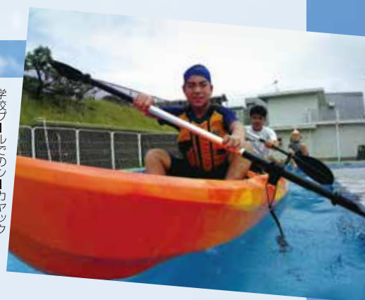
学校プールでのシーカヤック

三浦海岸共同生活に参加する本校6年生は、野外炊飯とシーカヤックの2つの活動に焦点を当て、事前に学校で学習に取り組みました。野外炊飯では畑にかまどを作り、火を起こしました。火が苦手だった児童も、火の扱いを学習することで自分から近づけるようになり、調理では一人で包丁を使って野菜を切ったり、切りやすいように野菜の向きを工夫したりできるようになりました。また、シーカヤックをプールに浮かべて練習をしました。パドルで交互に水をかいて進んだり、正しい乗り方を学習したり、安全に楽しく乗ることができるようになりました。これらの学習を通じて、三浦海岸共同生活本番では見通しをもって取り組み、多くの児童生徒と関わりながら楽しく過ごすことができました。