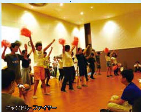
キャンドル・ファイヤー