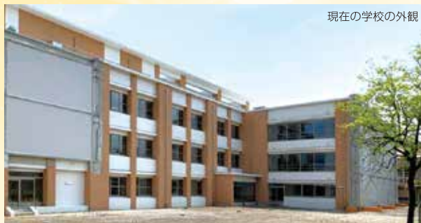
現在の学校の外観

桐が丘では新校舎の改築工事が進められています。現在、I期工事が完了し、令和の始まりと共に、待ちに待った5月から新校舎での学習が始まりました。