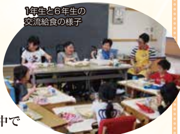
1年生と6年生の 交流給食の様子

各教室も明るく、広くなりました。1年生と6年生の交流給食もゆったりできて、和気あいあいです。