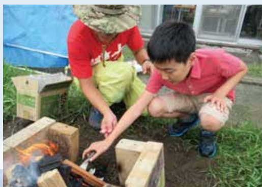
火起こしの事前学習