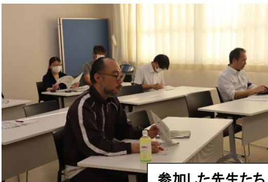
参加した先生たち