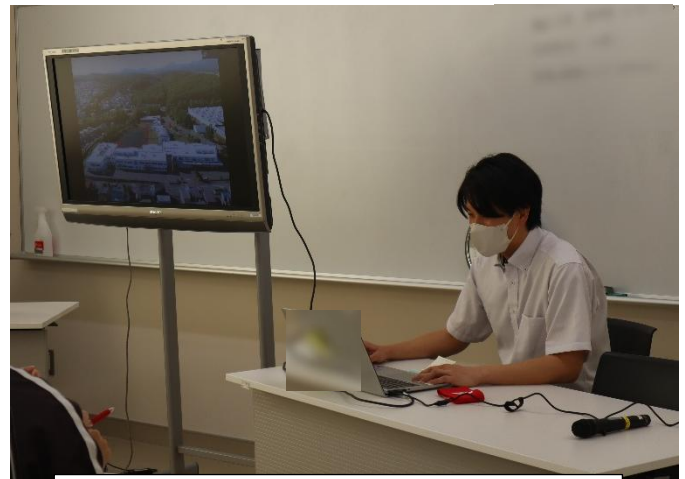
真駒内養護学校の紹介をしていただきました