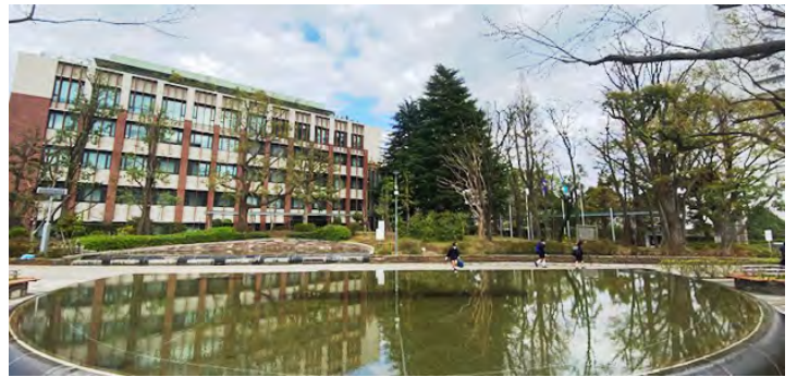
(東京キャンパス：教育の森公園から)