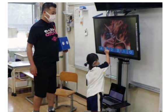
(聞き手：連携推進グループ 根岸由香)

「夢は知識」。子ども達の自立と社会参加を目指して、これからも楽しい授業や教材を工夫していきたいと思っています。