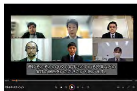
パネルディスカッションの様子