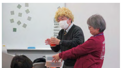
実演の様子(編み付きカッパ)