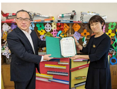
優秀賞 附属視覚特別支援学校