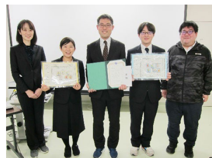
木村賞 附属桐が丘特別支援学校