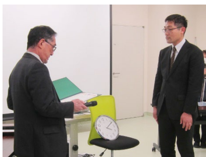
木村賞 附属桐が丘特別支援学校