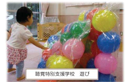
聴覚特別支援学校 遊び

圧縮袋に風船を入れ、空気を抜いて作ったカラフル風船ベッド。寝転がるとフワフワ、ポコポコとした感覚を楽しむことができます。桐が丘特別支援学校では、この風船の中に鈴を入れ、音楽を流しながら心地よい揺れや鈴の音色を楽しんでいます。