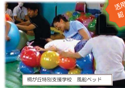
桐が丘特別支援学校 風船ベッド