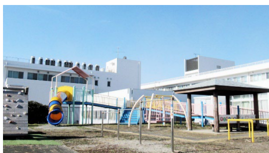
附属久里浜特別支援学校の様子