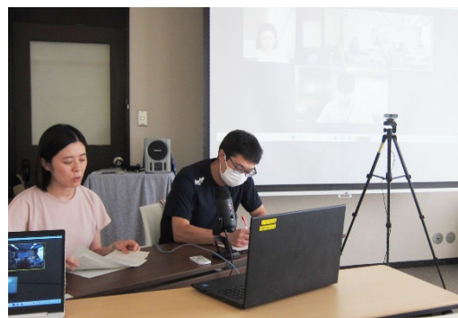
オンラインでの授業検討会の様子