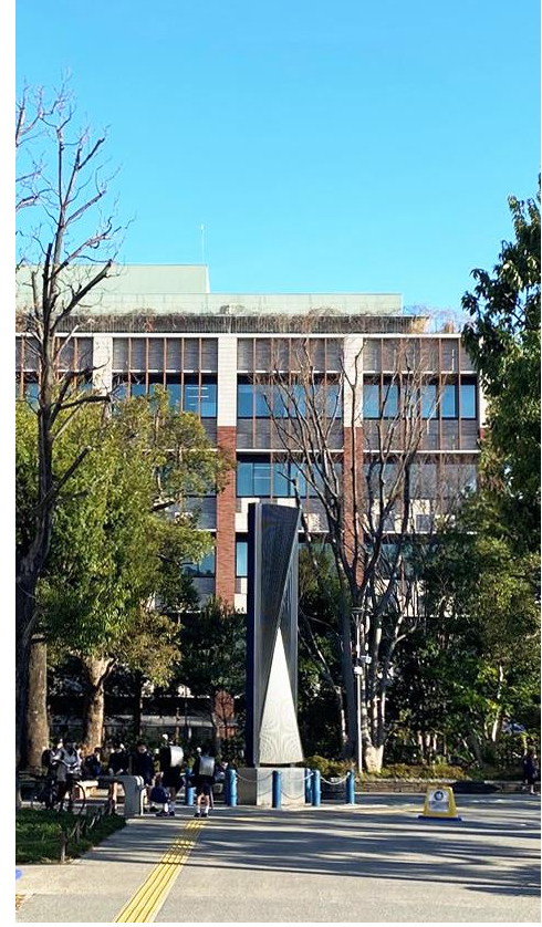
筑波大学東京キャンパス文京校舎