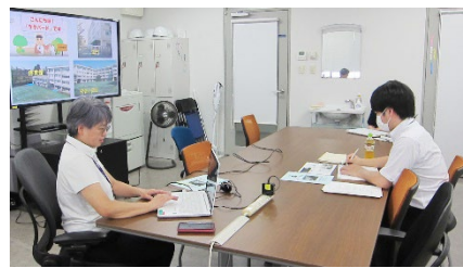
グループ員による講義