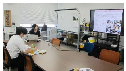
グループ員による講義