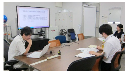
グループ員による講義