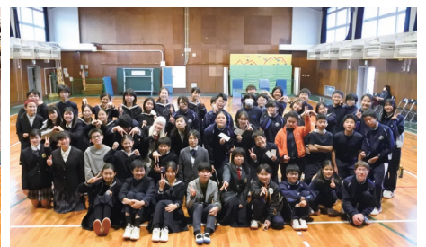
参加者で集まって集合写真