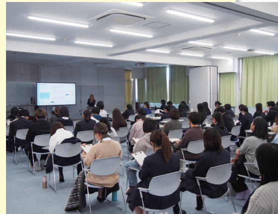
分科会での発表会の様子

令和7年度卒業研究発表会が11月28日(金)に本校で開催されました。本校の卒業研究は、専門学科時代の「課題研究」の取り組みが、総合学科の原則必修科目(当時)に引き継がれ、現在に至ります。本年度の卒業研究は、これまでの実践を振り返り、その理念を「三年間の学びの総括として教科・科目の学びを統合すること」、「探究活動を通じて、自己の在り方・生き方への考えを深めること」に集約して指導してきました。発表会当日は、教科・科目等の学びから着想した個性的な研究テーマ、将来のキャリアを見据えた制作活動など、生徒が1年間かけて取り組んできた多種多様な成果を、在校生・保護者の皆様と共有することができました。今年度の卒業研究は、地域、大学教員の方のご支援も頂き、充実した研究活動となりました。ご協力いただいた関係者の皆様に心より感謝申し上げます。