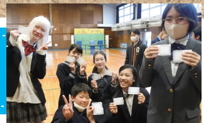
チーム内で点字名刺の交換

閉会式では、両校の生徒が事前に心を込めて用意した点字の名刺を、笑顔で交換し合う姿が印象的でした。短い時間の中で芽生えた友情が、これからも続いていくことを願わずにはいられません。企画・運営のほとんどを生徒たち自身が成し遂げた交流会、今後も継続的に実施することで、両校の生徒たちの学びと絆がさらに深まることを期待しています。