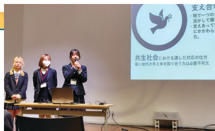
第2部 各校代表発表の様子

障害の有無や年齢の違いを超えて交流し、共生社会について考える貴重な時間となりました。今後も、児童生徒が互いを理解し合い、支え合う心を育む機会を大切にしていきたいと思います。