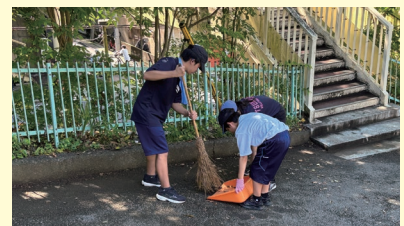
上級生を中心に、協力して活動しています