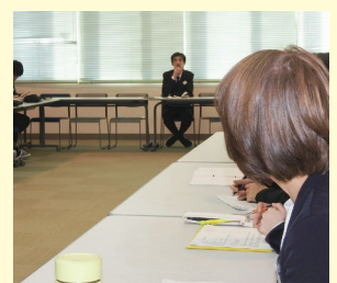
写真2:合評会で研究授業を振り返る