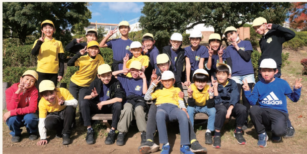
楽しさを共有する