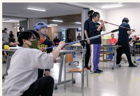
スポーツウェルネス吹き矢

このスポーツ大会を通して、自分の好きなスポーツや得意なことを見つけるとともに、異学年交流の楽しさを感じる機会となりました。今後も、児童生徒一人一人の様々な表情や素敵な姿が見られる大会にしていきたいと思えます。