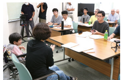
関係者への取材(昨年度の様子)

SSH予算は無くなりましたが、昨年度はNPO法人Kokomaba FLAP.からご支援をいただく等、生徒負担が重くない形での継続を模索しています。