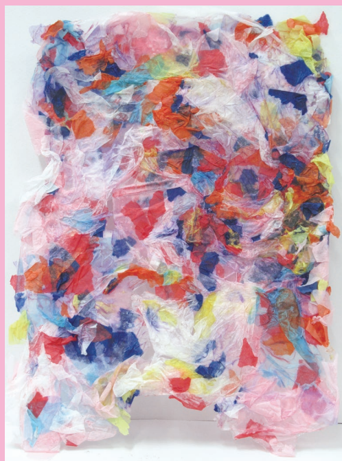
「カラフルアイランド」