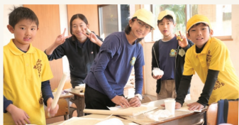
3年生と5年生でピザをつくる様子

これらの活動を通じて、最初に述べた他者意識の芽生えも、加速度的に深まっていきました。異学年交流というのは、教育的効果をさらに高めるための触媒という側面があるのではないのでしょうか。