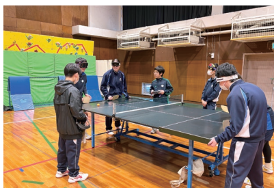
サウンドテーブルテニスのダブルス試合