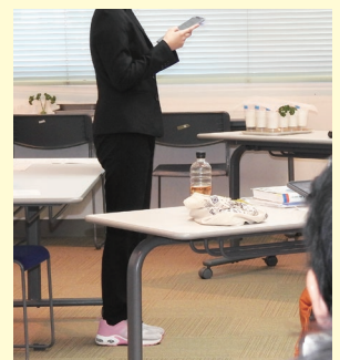
写真1:学習するビタミンを含む食物が机上に用意されている(奥の方、紙コップに入れられている)

診察学における協働学習と接遇意識を育てる授業をテーマとし、ゲーム感覚「デュエル」を採り入れた徒手検査法指導と、栄養素(特にビタミン)の学習時に実物を感覚すること、あるいは「実見、実感」を重視した認知促進を採り入れた授業でした(写真1)。実践後、この研究授業の振り返りを行う「合評会」が開かれました(写真2)。ここは研究授業の評価、考案、感想を陳べ合う場です。生徒の実態を把握し、それに即した指導・支援の方法を検討し実践するという教育実習は、新年度に視覚特別支援学校の教壇に立つ実習生にとって、何にも代えがたい宝となったはずで、視覚障害者の職業自立を支援するために、全国で活躍してくれることを祈念しつつ筆を置きます。