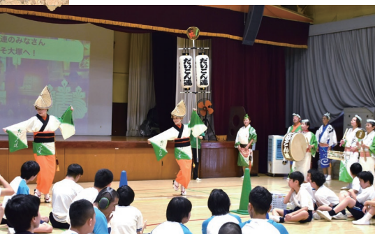
オリパラ交流会 (9月)

オープニングが行われ、高等部の生徒たちも、阿波踊りとファッションショーでオープニングを盛り上げました。『だいこん連』の皆さんもスペシャルゲストとして