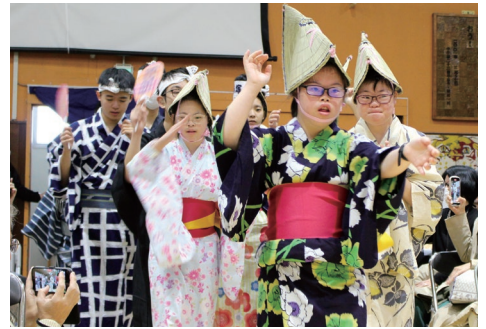
大塚祭オープニング(11月)

コロナ禍以降、全校行事を一緒に楽しむ機会が減少する中、阿波踊りをみんなで楽しむことで心をつなげてくれたように感じました。改めて、日本の伝統文化の魅力を再認識すると共に、オリンピック・パラリンピック教育における自国の文化を誇りに思う気持ちや、多様な背景を持つ人々との交流へと繋げていきたいと考えています。