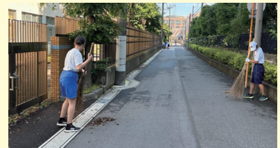
暑さに負けず、取り組みます

生徒の声から始まった活動が今、広がりを見せています。これからも生徒の「誰かのために」という気持ちを大切に、教育活動を充実させていきたいと思ひます。