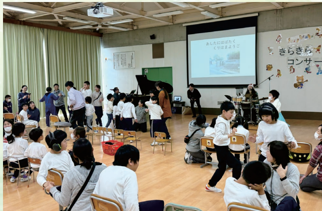
自然と体が動いて、曲を楽しむ児童（小学部）

コンサートや演奏会に参加することが難しい幼児・児童も、学校という慣れた場での開催や、なじみのある曲や授業で取り扱った曲を演奏することなどで、それぞれの楽しみ方で参加することができました。また、小学部の児童からは「また来てね。」という声が聞かれ、来年のコンサートを楽しみにしている様子もうかがえました。