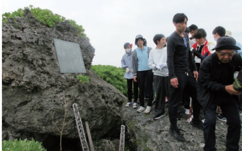
ひめゆり学徒隊が最期にたどり着いた場所へ

4日目はテーマ別行動で各班での学びを深めた後、空港に集合して帰路につきました。今回の修学旅行は、歴史を知り、文化に触れ、自然と向き合う中で、多くの気づきと成長を得る貴重な4日間となりました。