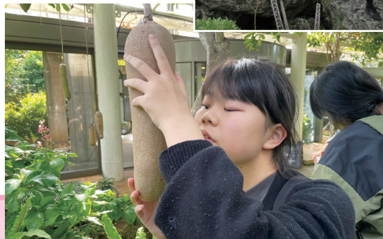
ソーセイジノキの葉の観察